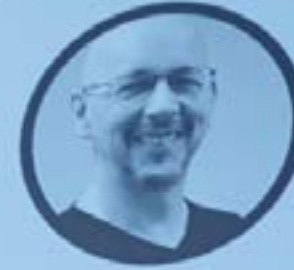
Sven O. Rimmelspacher Pickert & Partner GmbH